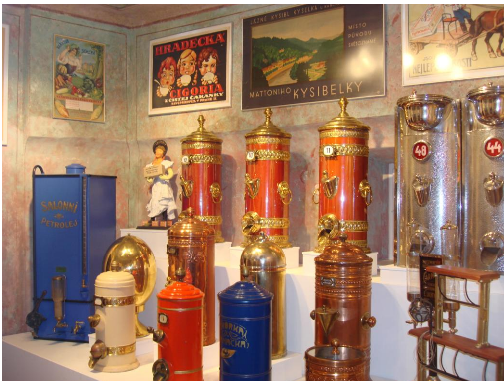
„C.K.Kupecký krám a Múzeum obchodu Český Krumlov“

Celá expozícia je zabezpečená EZS a vo vnútri bezdrôtovými premosteniami avizujúcimi prekročenie bezpečnostnej zóny.