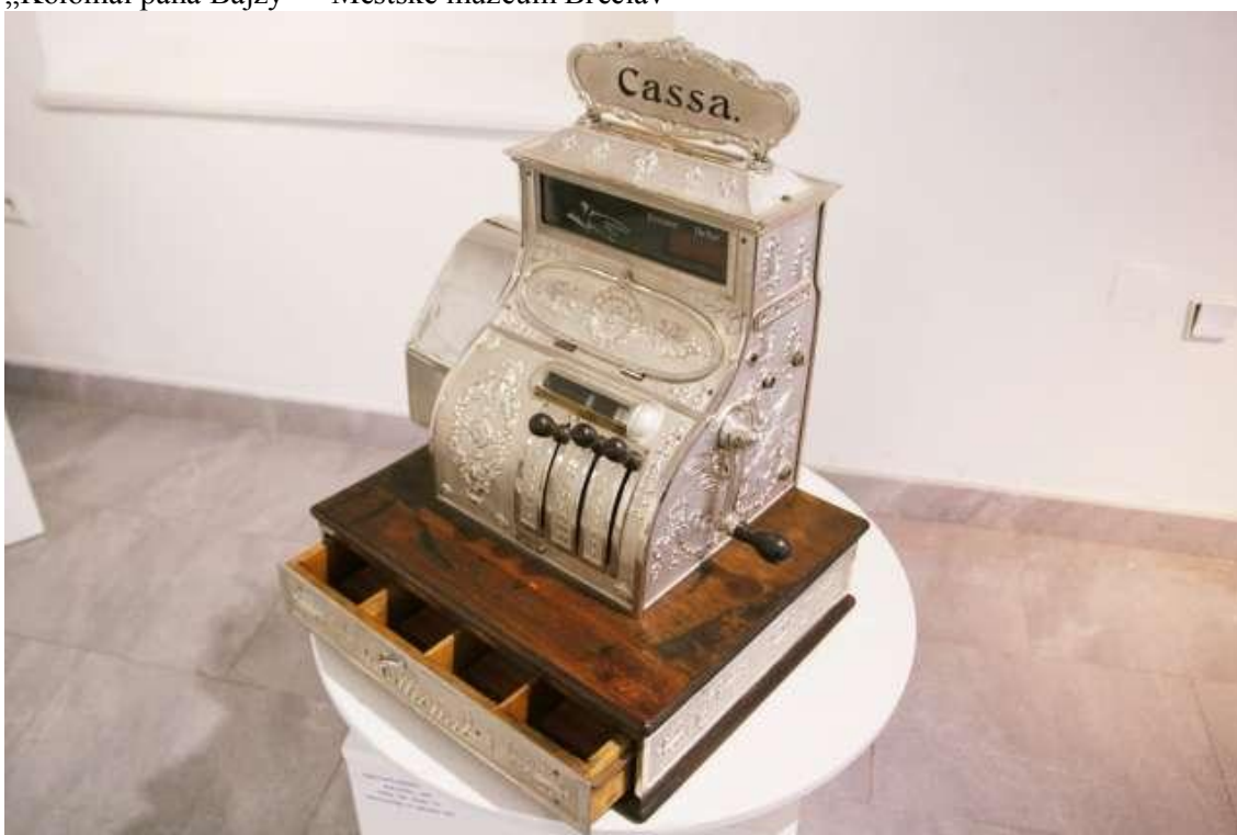
„Platím!!!“ – Múzeum Karlovy Vary

Múzeum zapožičalo kolekciu predmetov pre Múzeum Spiša v Spišskej Novej Vsi a ďalej sa podieľa aj na stálej expozícii Múzea Janka Kráľa v Liptovskom Mikuláši. Podobne pri realizácii novej expozície Múzea mincí a medailí v Kremnici, kde zapožičalo predmety doplnujúce interiér historického obchodníka. V Slovenskom Poľnohospodárskom múzeu v Nitre pomáhalo pri realizácii výstav a doplnení stálej expozície. Menšie množstvo predmetov zapožičalo aj do Múzea dopravy v Bratislave. Podobne Spišskému múzeu v Levoči. Múzeum zrealizovalo stálu prezentačnú výstavku v budove zriaďovateľa Ministerstva hospodárstva SR.