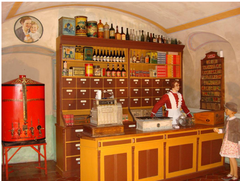
„C.K.Kupecký krám a Múzeum obchodu Český Krumlov“

Dôležitým pre prezentáciu múzea je aj realizácia časti stálej expozície novootvoreného Múzea Gastronómie v Prahe , venovanej obchodu a pohostinstvu. Múzeum nainštalovalo menšie nábytkové zariadenie obchodu so zmiešaným tovarom, ďalej tu prezentuje zásobníky na tovar, obalovú techniku, registračné pokladne a dobové reklamné prostriedky. Takto sa múzeum nastalo prezentuje aj v hlavnom meste Českej republiky.