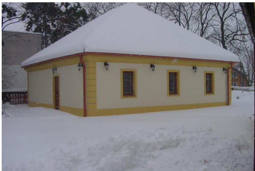
Ten istý pohľad, stav po ukončení a kolaudácii v roku 2012.

Doprava bola zabezpečovaná výlučne osobným motorovým vozidlom VW Caddy, najjazdené 340.000 km, výnimočne Daewoo Nexia, najjazdené 310.000 km. Obe vozidlá majú relatívne vysoký počet najjazdených km, preto bolo zrealizované, plánované obstaranie nového motorového vozidla Mercedes Benz Vito, ktorý svojimi parametrami plne vyhovuje aj na prevoz stredne veľkých a menších výstav, či bezpečný prevoz predmetov v rámci akvizícií. Dopravu bude treba objednávať v budúcnosti len veľmi ojedinele, alebo vôbec nie.