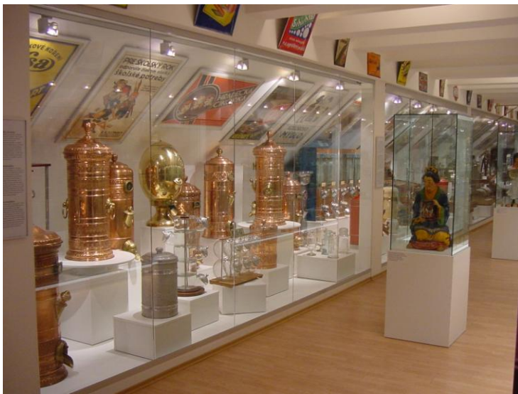
Stála expozícia Podunajské Biskupice – zásobníky a registračné pokladne

Rozvrhnutie a scenár expozície v Podunajských Biskupiciach predurčila samotná konštrukcia krovu. Takto sa vytvorili akési oddelenia, do ktorých sa nainštalovali jednotlivé skupiny predmetov podľa katalogizačného triednika, ako prehliadka najatraktívnejšieho, čo v zbierkovom fonde múzea je. Sú to váhy všetkých typov, obaly všetkých typov, kartónová interiérová reklama, počítaacie stroje, prostriedky predaja a propagácie piva, registračné pokladne, zásobníky na tovar všetkých typov a pomôcky na úpravu a manipuláciu s tovarom. Dôležitým prvkom je interiér obchodníka so zmiešaným tovarom do ktorého môže návštevník vstúpiť. Ako solitéry sú v komunikačnom priestore umiestnené sadrové, kaširované reklamné pútače. Na stenách celého priestoru sú nainštalované reklamné plagáty a smaltované a plechové reklamné tabule. Do priestoru bol umiestnený zásuvkový zakladač pražskej firmy Lotech, na plagáty, písomnosti a drobné predmety. Expozícia má 4 okruhy ozvučenia, efektne osvetlenie a je opatrená audiovizuálnou technikou. Celá expozícia je bezbariérová vrátane výtahu a WC pre telesne postihnutých návštevníkov. Expozíciu navštevujú najmä študenti Filozofickej fakulty, Ekonomickej univerzity, obchodných akadémií a iných stredných a základných škôl z celého Slovenska, stáva sa totiž zastávkou školských zájazdov smerujúcich do Bratislavy.