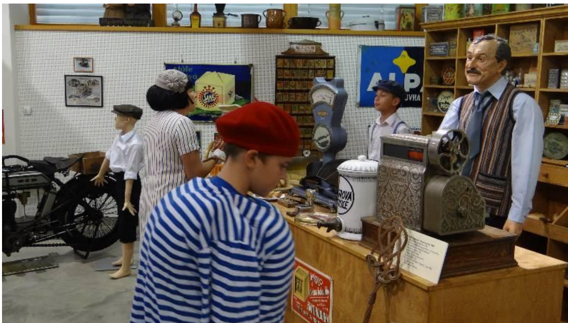
„Koloniál pana Bajzy“ – Městské muzeum Břeclav