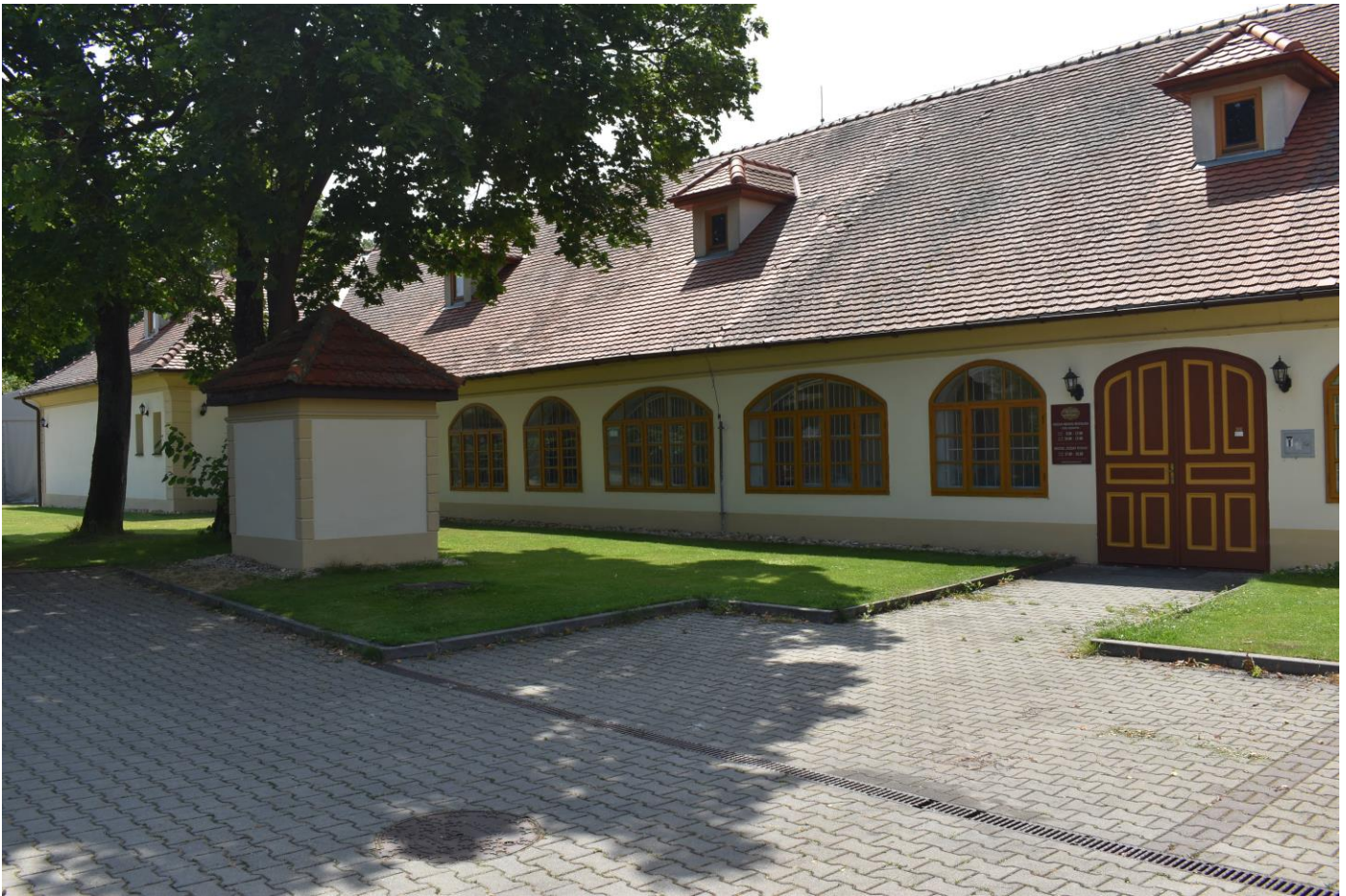
Múzeum obchodu Bratislava