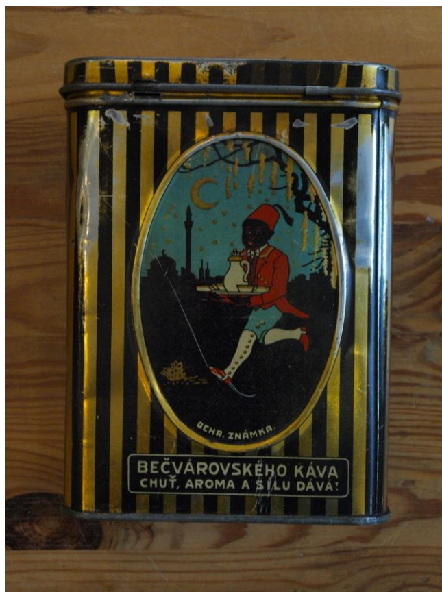
Predmety z akvizície 2020.