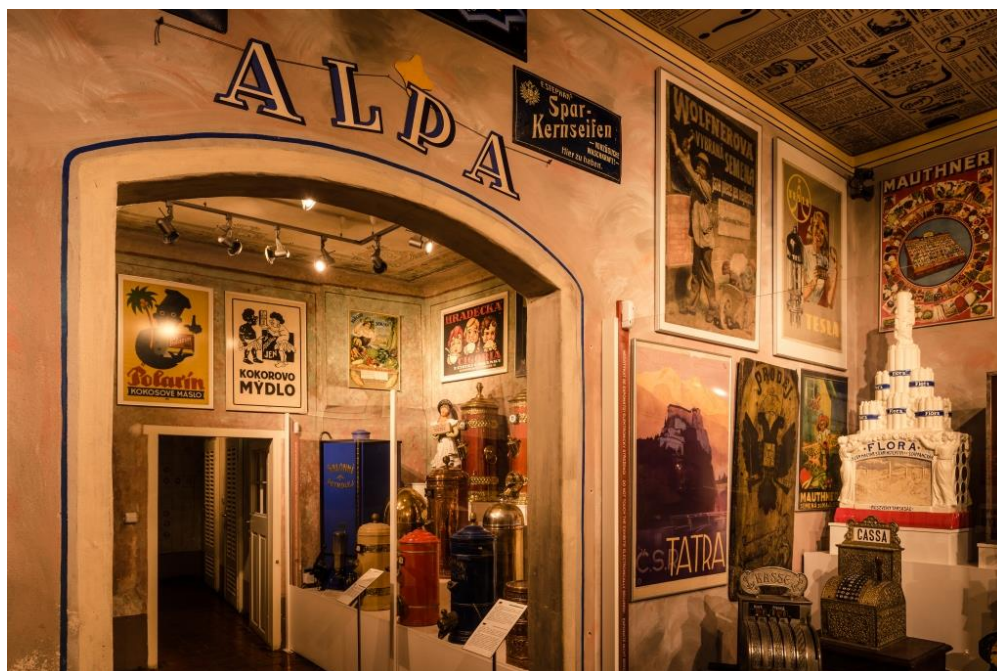
„C.K.Kupecký krám a Múzeum obchodu Český Krumlov“

Expozícia „Prešporský koloniál - Obchod v múzeu“ umiestnená na prízemí goticko-renesančného domu, predstavuje podobný model, ako „krumlovska“. Vo vstupnej miestnosti zariadenej dobovým obchodným nábytkom a všadeprítomnou, historickou reklamou, ponúka partnerská firma Donet potraviny a nápoje so zameraním na unikátnych slovenských výrobcov a suveníry so vzťahom k Bratislave. V druhej miestnosti je expozícia zameraná na registračné pokladne firmy National, Krupp, Anker, Invicta a iných, doplnená sprievodnými textami a dobovou reklamou. V druhej miestnosti sú predmety z návštevnícky najatraktívnejších skupín, ako zásobníky na tovar, váhy, obaly, či historická chladnička na zmrzlinu. Vitríny sú venované výlučne historickým bratislavským firmám a ukážkam ich produkcie, alebo tovarov, ktoré predávali. Všetko je opäť doplnené historickou reklamou.