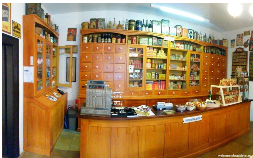
„Prešporský koloniál - Obchod v múzeu“

Expozícia „Prešporský koloniál - Obchod v múzeu“ umiestnená na prízemí goticko-renesančného domu, predstavuje podobný model, ako „krumlovska“. Vo vstupnej miestnosti zariadenej dobovým obchodným nábytkom a všadeprítomnou, historickou reklamou, ponúka partnerská firma Donet potraviny a nápoje so zameraním na unikátnych slovenských výrobcov a suveníry so vzťahom k Bratislave. V druhej miestnosti je expozícia zameraná na registračné pokladne firmy National, Krupp, Anker, Invicta a iných, doplnená sprievodnými textami a dobovou reklamou. V druhej miestnosti sú predmety z návštevnícky najatraktívnejších skupín, ako zásobníky na tovar, váhy, obaly, či historická chladnička na zmrzlinu. Vitríny sú venované výlučne historickým bratislavským firmám a ukážkam ich produkcie, alebo tovarov, ktoré predávali. Všetko je opäť doplnené historickou reklamou.